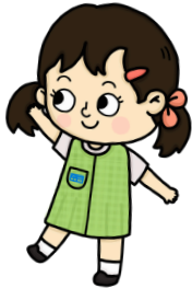
Photo 1 inch